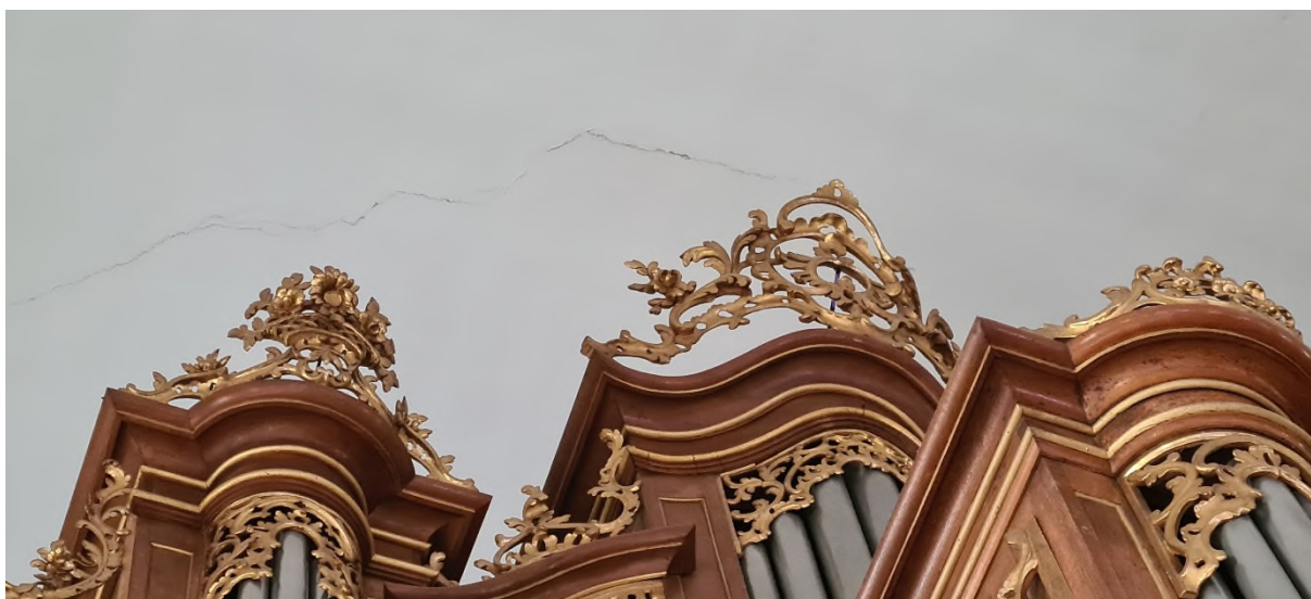
Fissure du plafond au-dessus de l'orgue

Le plafond voûté du Temple présente, à de nombreux endroits, des fissures plus ou moins importantes qui nécessitent d'être réparées. Le risque de décollement de morceaux de plâtre est important et ne peut être assumé plus longtemps. Les travaux projetés prévoient le traitement des fissures ainsi que l'application d'une nouvelle peinture. La mise en place d'un échafaudage avec plate-forme de travail sera nécessaire et empêchera provisoirement l'usage du Temple. La méthodologie d'intervention a été mise au point avec la Division Monuments et sites de l'Etat de Vaud, qui validera chaque étape des travaux.