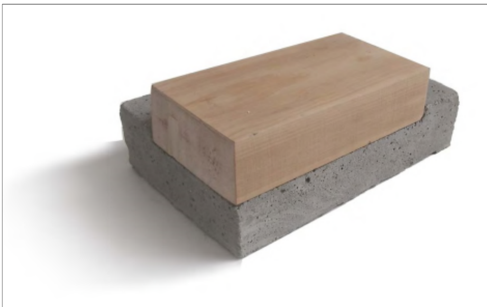
Concept du projet : un socle minéral, une surélévation en bois

Le jury salue un projet qui par sa simplicité, ses qualités plastiques et sa clarté constructive et matérielle répond parfaitement au contexte environnant, en particulier au bâtiment historique du Château, en y apportant une réponse à la fois contemporaine et intemporelle, discrète et élégante. »