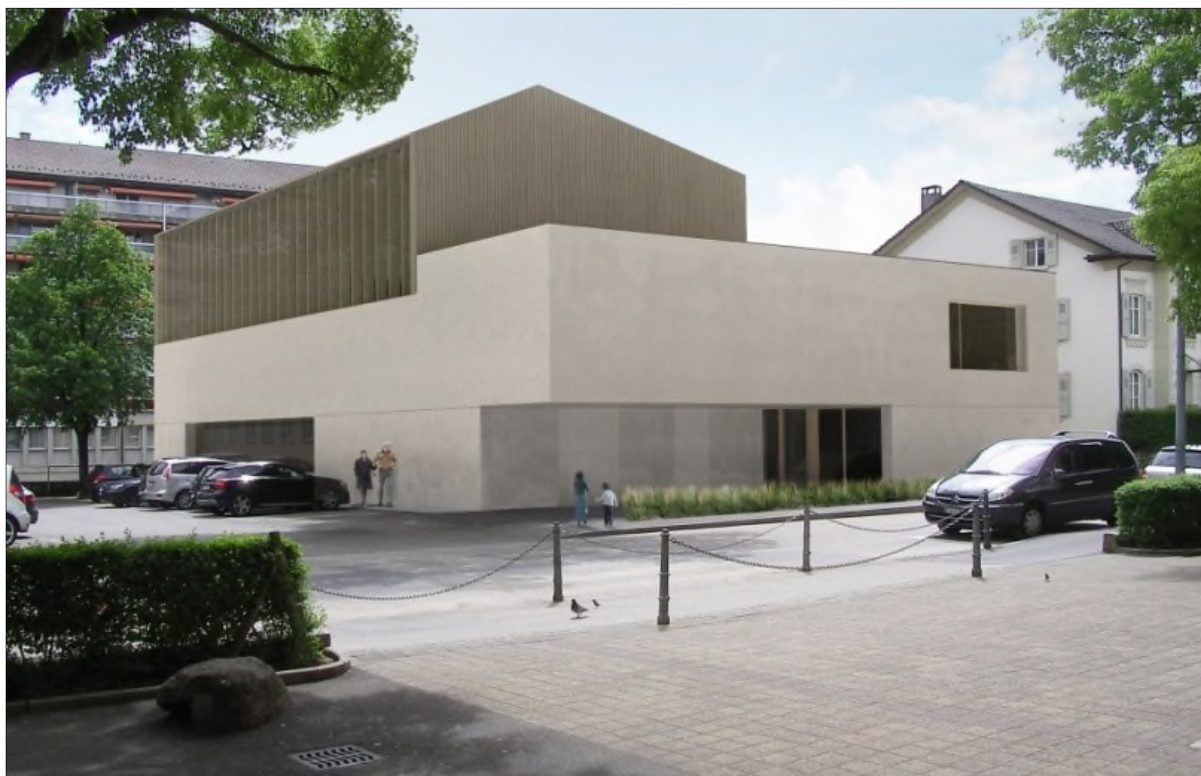
Vue depuis le Collège Pestalozzi

Si les études ont pris plus de temps que prévu initialement, notamment en raison de la nécessité d'ajustements budgétaires (cf. infra 2.4), la Municipalité bénéficie désormais d'un projet solide et se trouve en mesure de lancer la réalisation des travaux, sous réserve de l'acceptation de la présente demande de crédit d'investissement.