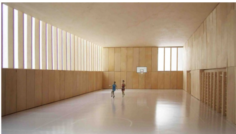
La salle de gymnastique