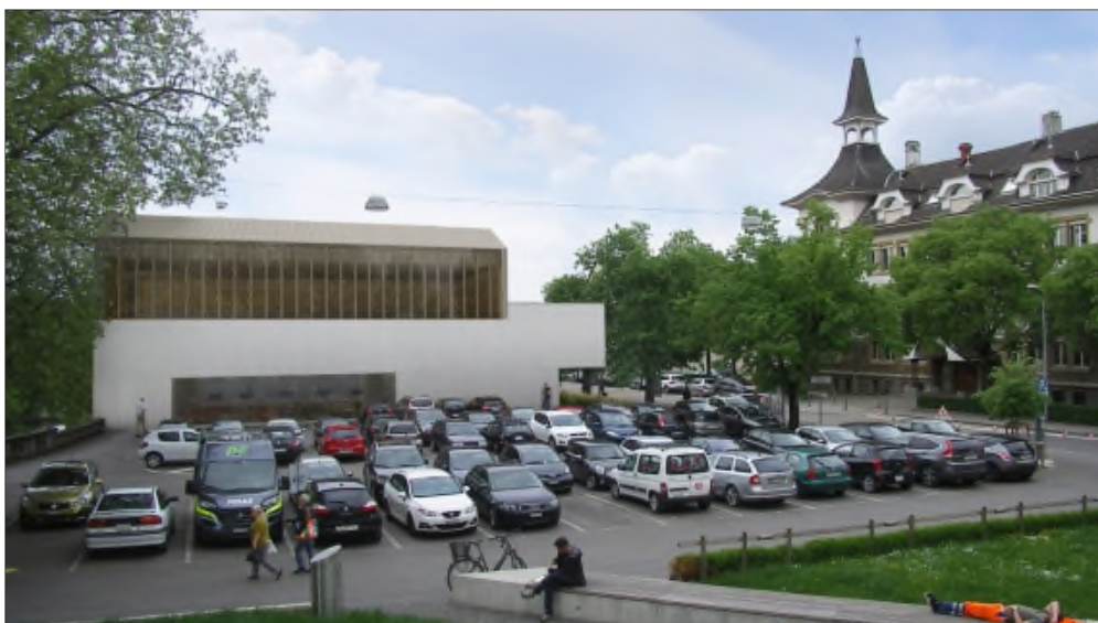
Vue depuis le Château