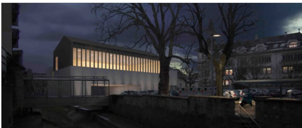
Vue de nuit

Le programme des locaux est celui énoncé lors du concours et correspond aux besoins, tant des écoles que des sociétés locales.