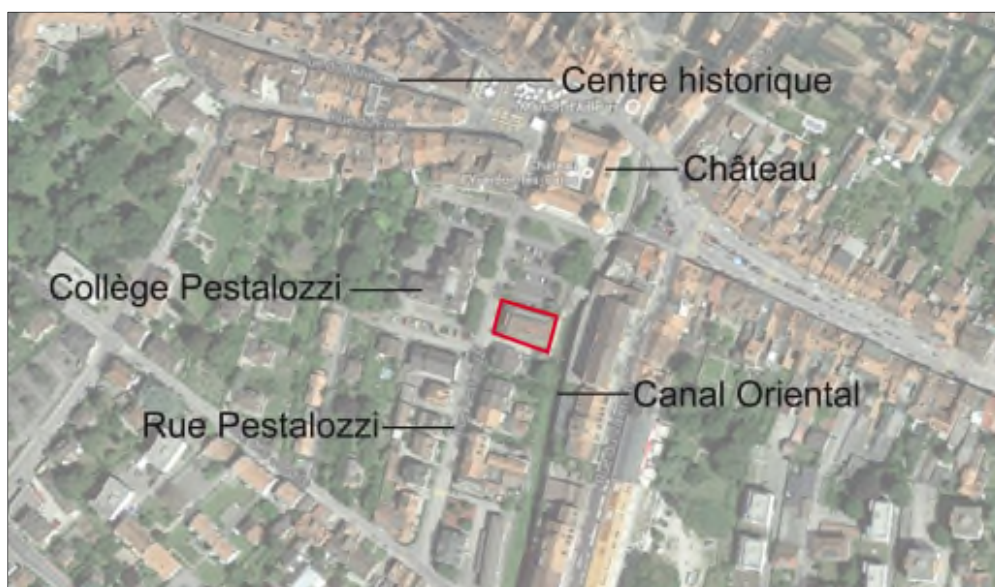
Situation de la salle de gymnastique

Le concours d'architecture comportait dans son jury des membres de la Commune, des architectes ainsi que le Conservateur cantonal des monuments et sites de l'Etat de Vaud. En effet, l'emplacement du bâtiment, vis-à-vis du Château, a des implications importantes sur le site et le monument considéré.