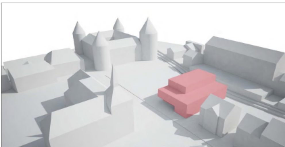
Emplacement : face au Château, avec une partie basse côté rue