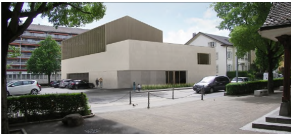
Vue depuis le Collège Pestalozzi